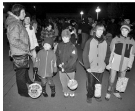
LAMPIONOVÝ PRŮVOD ROZZÁŘIL VEČERNÍ ULICE MĚSTEČKA