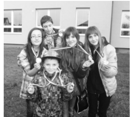
RADOST Z MEDAILOVÝCH ÚSPĚCHŮ