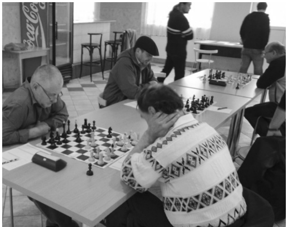
V ZÁPALU ŠACHOVÉHO KLÁNI