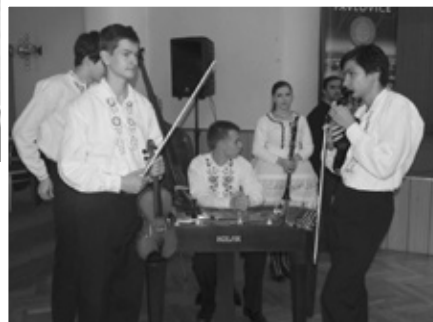
K DOBRÉ POHODĚ VYHRÁVALA CIMBÁLOVÁ MUZIKA LAŠÁR