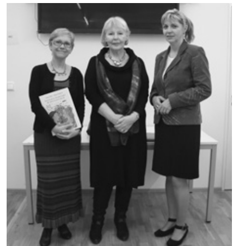
Z VERNISÁŽE VÝSTAVY

Vernisáž výstavy se nesla v příjemné atmosféře, snad už i trošku podpořené blízcím se adventem, který byl i námětem několika obrazů. Ti, kteří si díla pečlivě prohlédli, mezi nimi určitě našli motivy známého brněnského Zelného trhu se stánky sladce vonících trdelníků či oranžově zářícími pomeranči na pultech zelinářů. Kulturní program slavnostního zahájení výstavy si vzala