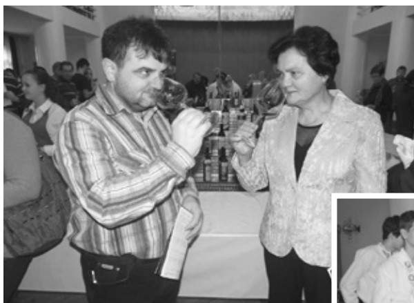
OCHUTNÁVKA VÍN BÝVÁ VŽDY PŘÍJEMNOU SPOLEČENSKOU UDÁLOSTÍ