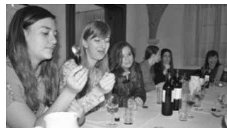
MERUŇKOVÉ MARMELÁDY BYLY VÝTEČNÉ