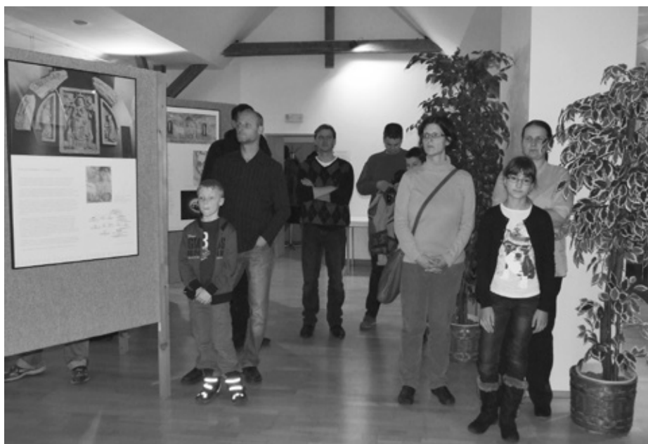
Z VERNISÁŽE VÝSTAVY Z DOBY STŘEDOVĚKU