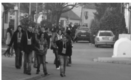
VINAŘI ZE SPOLKU VÍNO Z VELKÝCH PAVLOVIC MĚLI CO NABÍDNOUT

Letos se oblíbená vinařská akce ve Velkých Pavlovicích uskutečnila v sobotu 16. listopadu 2013, necelý týden po svátku sv. Martina. Kdybychom se vydali hledat historické prameny Svatomartinské tradice, vrátili bychom se až do 18. století, do období vlády císaře Josefa II.. Tehdy o magickém datu 11. 11., na svátek sv. Mar-