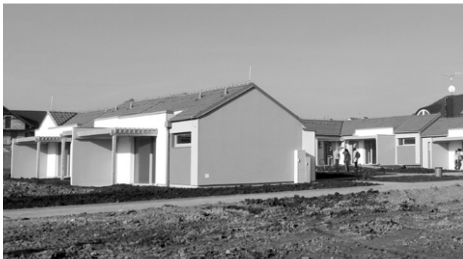
PRVNÍCH 9 BYTŮ PRO SENIORY V UL. BŘÍ MRŠTÍKŮ

Byty jsou vystavěny samostatně v poměrně klidné nové lokalitě řadové výstavby rodinných domů. Každý má bezbariérový přístup, sociální vybavení a malou terasu s pergolou. Pěkné podzimní počasí přálo posledním dokončovacím pracím a terénním úpravám v okolí. V dokonalé parko-