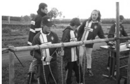
HASIČSKÝ DOROST SI NA VLASTNÍ KŮŽI VYZKOUŠEL, CO TO KDYSI BÝVALA A DNES UŽ ZNOVU JE HRA PLAMEN.

Po mnohaleté odmlce se do Velkých Pavlovic vrátila Hra Plamen pro mladé hasiče. Stalo se tak v říjnu 2013. Jednou ze soutěžních disciplín je i branný závod a štafeta družstev.