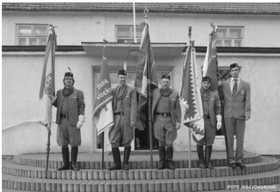
PRAPOREČNÍCI V SOKOLSKÝCH KROJÍCH

vrátili zpět do Velkých Pavlovic, zatančili nám také Přátelé country. Po živém vystoupení v rytmu country zacvičily ženy opět sletovou skladbu Českou suitu od Antonína Dvořáka. Po lyrickém vystoupení žen nastoupili muži v krojích a sálem se rozezněl folklorní zpěv zdejšího Presúzního sboru. Poslední sletovou předvedenou skladbou byli muži a to ve skladbě Chlapci III. Po ukončení posledního cvičení