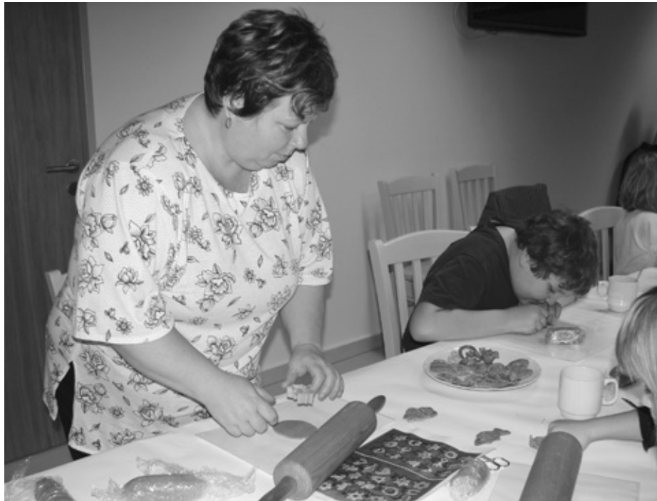
VIZOVICKÉ PEČIVO PEKLI VŠICHNI, MALÍ, VELCÍ, HOLKY, KLUCI... NEJEDEN VÁNOČNÍ STROMEČEK V DUCHU LIDOVÝCH TRADIC OZDOBILO.