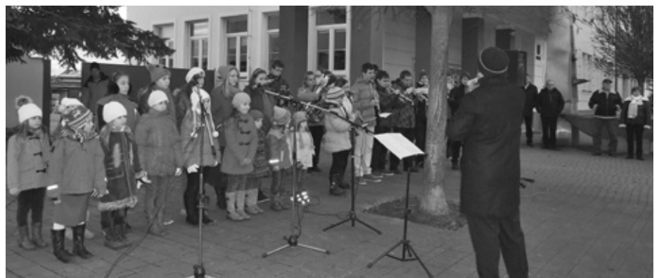
SOUBORY ŽUŠ PŘI ROZSVÍCENÍ VÁNOČNÍHO STROMU