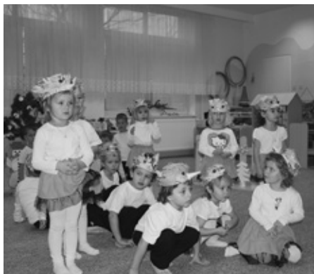
PTÁČCI V ZIMĚ VE TŘÍDĚ BERUŠEK

Po těchto slovech začalo čertí a mikulášské rejdnění v naší mateřské škole. Než přišel opravdový čert s Mikulášem, tak děti předvedly v krátké „besídce“ co všechno se naučily, jak jim jdou říkanky, tanečky a dokázaly, že mají „pro strach uděláno“. Ve třídě Kuřátek stála velká čertovská pec,