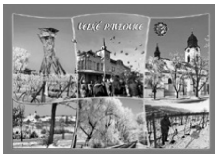
Nová pohlednice města Velké Pavlovce se zimním motivem.

Už v polovině měsíce října myslely pracovníce Turistického informačního centra na nadcházející zimu a Vánoce a ve spolupráci s Městem Velké Pavlovce vydaly trio zbrusu nových zimních pohlednic. Jedna z nich navíc může posloužit jako originální vánoční přání z Velkých Pavlovic. Pohlednice si můžete zakoupit na TIC, cena je 5,- Kč za kus.