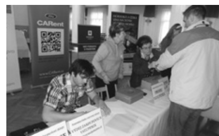
NÁVŠTĚVNÍKŮ BYLO PLNO A POŘADATELÉ MĚLI PILNO

ně měnit ověřenou značku „BEST OF“ za třeba nižší standarty. Jistota je jistota.