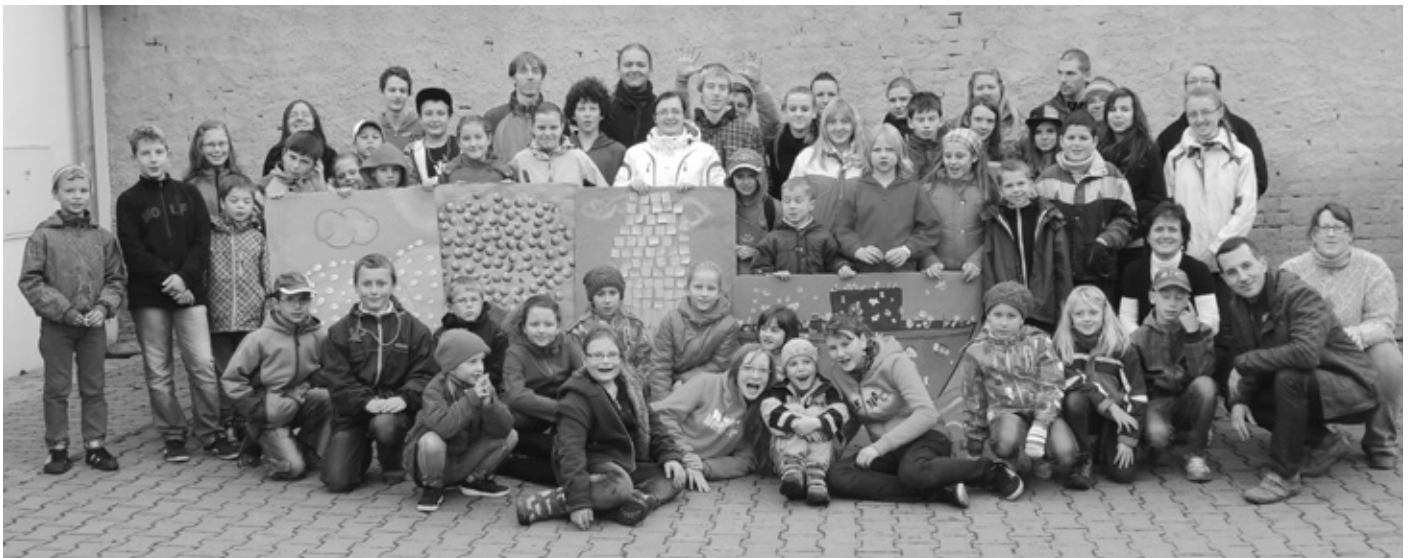
MY VŠICHNI Z PODZIMNÍ VÍKENDOVKY V TĚŠANECH, VÍC UŽ NÁS BÝT ANI NEMOHLA :-)