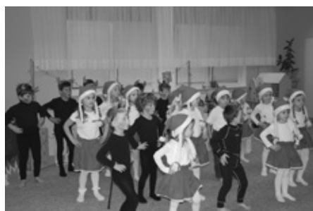
SLUNÍČKA TENTOKRÁTE ZA MIKULÁŠKYA ČERTÍKY

čertice i čertíci předvedli své taneční kreace-podle reprodukováné hudby. U sluníček k nim přibyli i Mikulášci, aby i kladné postavy byly zastoupeny. V Kotátkách panovala zcela vánoční pohoda – hudební scénka s živým betlémem pohladila oko i duši. A co u Berušek? Tam děti představovaly ptáčky v zimě, tančily, hrály na ozvučné nástroje a pak přišla ta chvíle-všechny třídy navštívil Mikuláš se svou