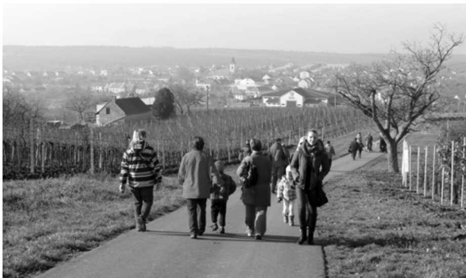
VÝŠLAP PODZIMNÍ KRAJINOU, SE SLUNÍČKEM NA OBLOZE, SE VYDAŘIL