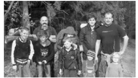
MLADÍ VLCI NA KRÁSNÉM PODZIMNÍM TÁBOŘENÍ V PŘÍRODĚ

Mimo výuky táborských dovedností s ověřením si faktu, že i v tomto ročním období můžeme pohodlně tábořit v přírodě, jsme prováděli přírodovědný výzkum okolních lesů a při něm jsme například našli mraveniště velké 110 centimetrů. Poznávali jsme jehličnaté stromy a pořizovali materiál pro sbírku modrotiskových otisků listů stromů a keřů. Vařili jsme na ohni, podnikali noční pochod. Dopoledne jsme hráli hry s míčem i talířem. Na zpáteční cestě jsme navíc nečekaně zažili exkurzi v kanceláři výpravčího železniční