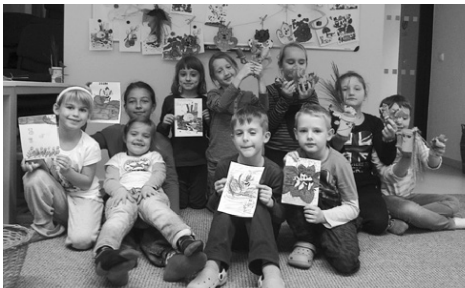
JAK NALOŽÍ SE DVĚMA DNY PODZIMNÍCH PRAZDNIN? TYTO DĚTI SI JE BÁJEČNĚ UŽILY SE SUPER PROGRAMEM V EKOCENTRU TRKMANKA. (FOTO: LENKA ŠTEFKOVÁ)

A nám nezbyvá, než se těšit na další prázdninové setkání v únoru... Tentokrát přírodní kurz s podtitulem „Příroda není nuda“ – více se o tomto kurzu dovíte na www.ekocentrum-trkmanka.com .